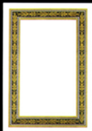
Urkunde 10 N Größe 30 x 42 cm, Golddruck und dunkelgrün