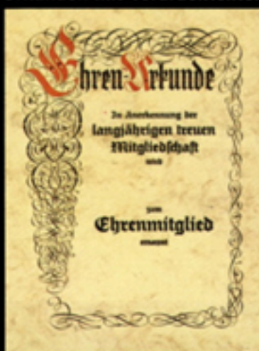
Nr. 036/T Größe 24 x 32 cm, mit diesem abgebildeten Vordrucktext lieferbar