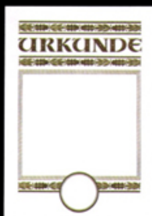
PC-Urkunde 3AB-PC Größe 21 x 29,7 cm