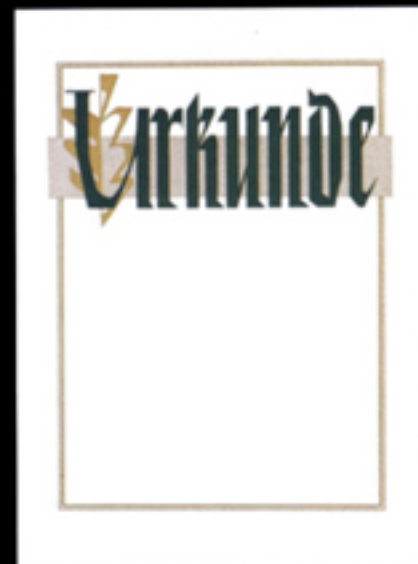
Nr. 22 Größe 24 x 32 cm, zweif. gold-dunkelgrün