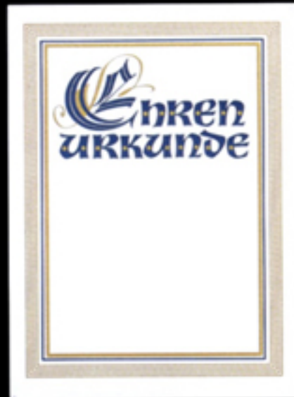
Nr. 27 Größe 24 x 32 cm, zweif. gold-blau