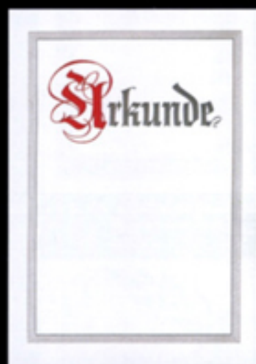
Nr. 562 21 x 29,7 cm Nr. 562-PC 21 x 29,7 cm rot-dunkelgrau