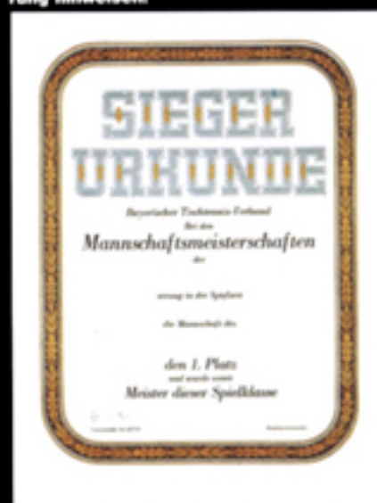
Nr. 120 (ohne Text) Größe 24 x 32 cm, mit Gold- oder Silberausführung. -Siegerurkunde- blau-gold oder silber, Rahmen dunkelbraun-gold oder silber.

Bei Bestellung auf Gold- oder Silberausführung hinweisen!