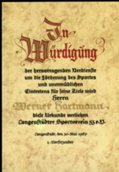
Nr. 32 Größe 30 x 42 cm, mit Text u. Zusatzbeschriftung als Beispiel. Name, Vereinsbezeichnung und Datum schwarz-gold oder rot als Nr. 33 T