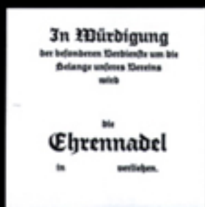
Lagerstext T11 für Urkunde 37