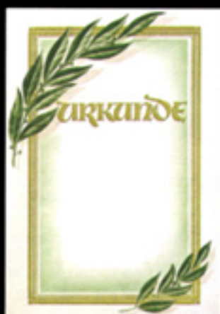
Urkunde 16 Größe 21 x 29,7 cm