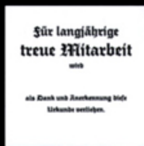
Lagerstext T12 für Urkunde 37