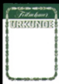
Nr. 304 A 15 x 21 cm