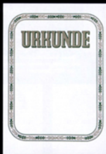
Nr. 131 Größe 21 x 29,7 cm, grau-grün