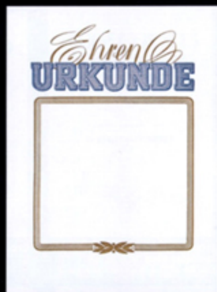
Nr. 234 Größe 24 x 32 cm, blau-gold