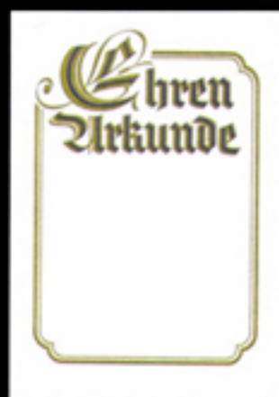
Urkunde 25 Größe 21 x 29,7 cm, Golddruck