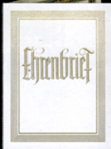
Nr. 173 Ehrenbrief, doppelblättrig Größe 24 x 32 cm, geöffnet 32 x 48 cm, mit weiß geflochtener Kordel, Golddruck, Wort «Ehrenbrief» ist goldhochgeprägt. 3. Innenseite Eichenlaub-/Orbeerumrandung gold-dunkelbraun.

Bei Bestellung bitte auf Gold- oder Silberausführung hinweisen!