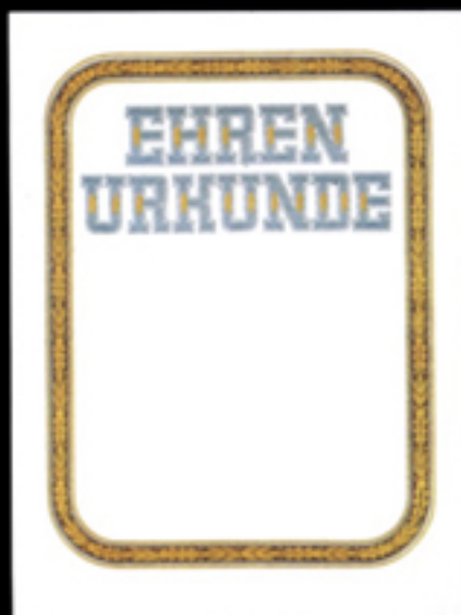
Nr. 121 Größe 24 x 32 cm, in Gold- oder Silberausführung. -Ehrenurkunde- blau-gold oder silber, Rahmen dunkelbraun-gold oder silber.

Bei Bestellung auf Gold- oder Silberausführung hinweisen!