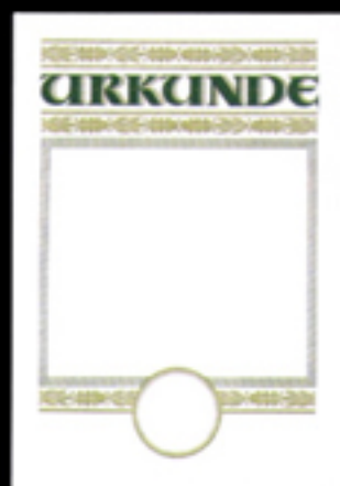
Urkunde 2 a/B Größe 21 x 29,7 cm