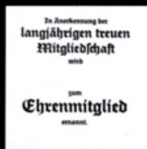
Lagerstext T10 für Urkunde 37

Bei Bestellung Lagerstext-Nr. u. Urkunden-Nr. angeben!