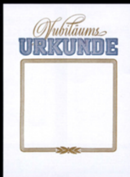
Nr. 233 Größe 24 x 32 cm, blau-gold