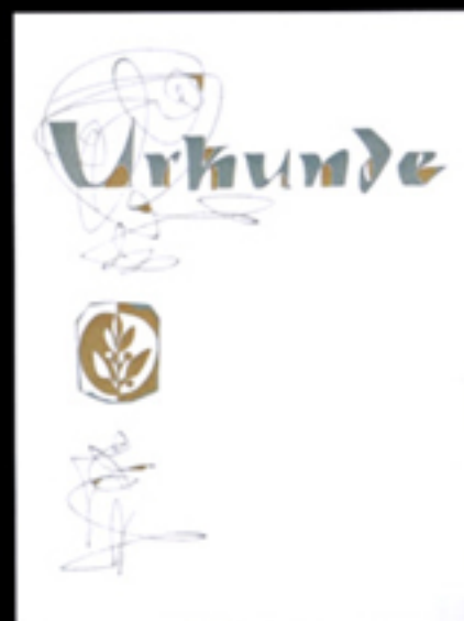
Nr. 24 Größe 24 x 32 cm, zweif. gold-blaugrau

Bei Bestellung auf Gold- oder Silberausführung hinweisen!