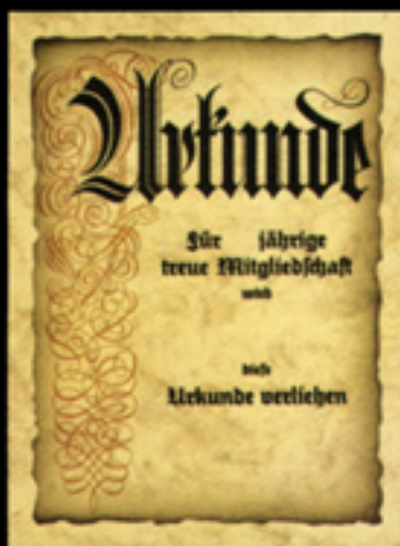
Urkunde 37/T Größe 24 x 32 cm Urkunde 37/1-T Größe 30 x 42 cm mit diesem abgebildeten Vordrucktext lieferbar

Änderungen oder Eindruck auf andere Urkunden müssen zum normalen Textendruckpreis berechnet werden.