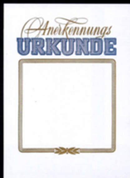
Nr. 232 Größe 24 x 32 cm, blau-gold