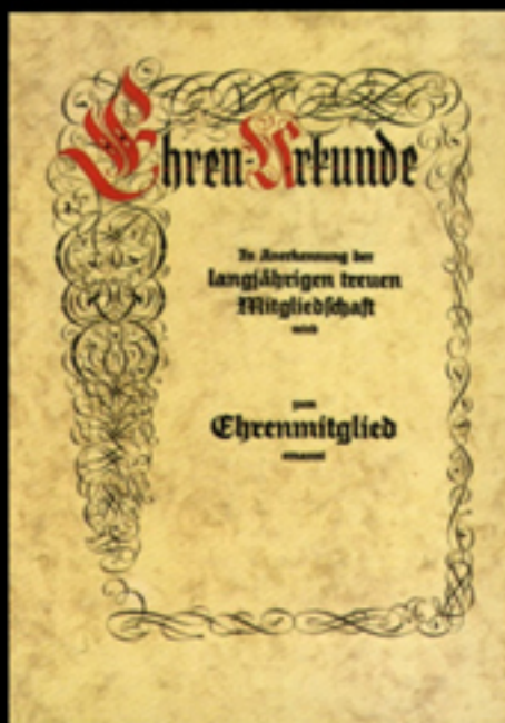
Nr. 36/T Größe 30 x 42 cm, mit diesem abgebildeten Vordrucktext lieferbar