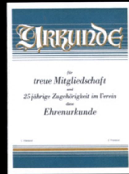
Nr. 23 (ohne Text) Größe 24 x 32 cm, zweif. gold-blaugrün