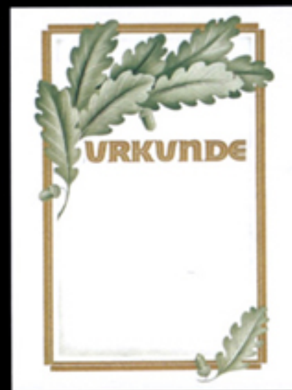
Nr. 14 Größe 24 x 32 cm, -Urkunde- und Linienrahmen ist gold, alles übrige grün. Auch ohne -Urkunde- lieferbar als 14 N .

Bei Bestellung auf Gold- oder Silberausführung hinweisen!