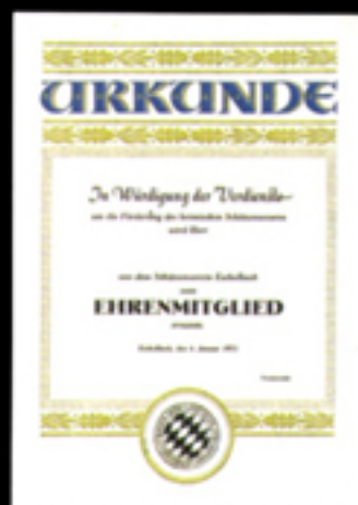
[ohne Text] Urkunde 1 a/B Größe 24 x 32 cm Das Wort «Urkunde» hochgeprägt.