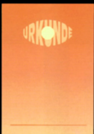
PC-Urkunde 102-PC Größe 21 x 29,7 cm