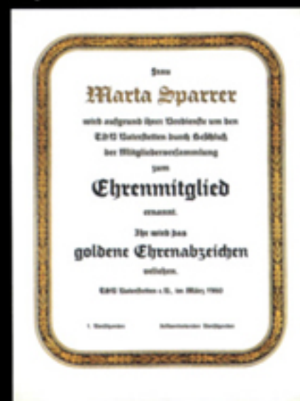
Nr. 121 N (ohne Text) Größe 24 x 32 cm, zweifarb. Eichenlaub-Lorbeerumrandung dunkelbraun-gold oder silber.

Bei Bestellung auf Gold- oder Silberausführung hinweisen!