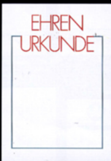
Nr. 101-PC Größe 21 x 29,7 cm grau-rot