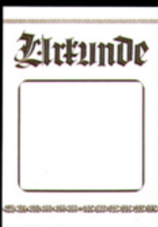
PC-Urkunde 130-PC Größe 21 x 29,7 cm