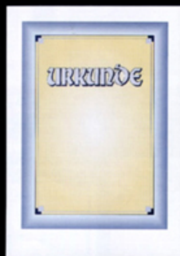
Nr. 100-PC Größe 21 x 29,7 cm blau-ocker