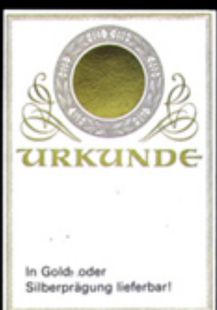
PC-Urkunde 56/1N-PC Größe 21 x 29,7 cm neutral ohne Prägung