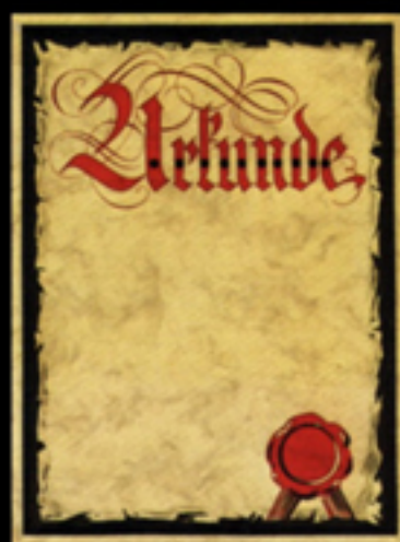
Nr. 48-PC Größe 24 x 32 cm