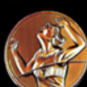
606 Lauf Damen