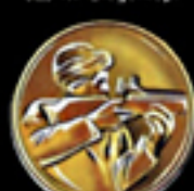
* 648 Schutzensport