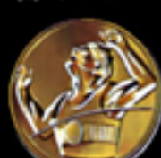
605 Leichtathletik (Lauf)