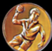
* 603 Handball