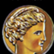
625 F Siegerkopf w