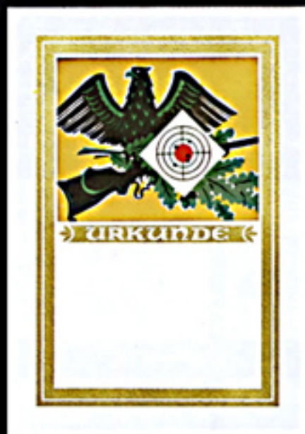
Urkunde 39 Größe 30 x 42 cm, Golddruck

Die Bildmotive für diese Urkunden sind besonders groß und sehr wirksam Bei Bestellung Urkunden-Nr. und Bild-Nr. angeben!