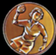
604 Handball Da