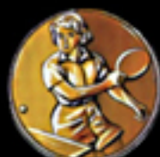
608 T. Tennis Da