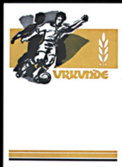
Urkunde 63 A Fußball 24 x 32 cm, Golddruck, zweifarbig dkl. grün-gold