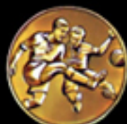
* 601 Fußball

Bei Bestellung Urkunden-Nr. und Bild-Nr. angeben!