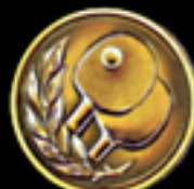
* 639 Tischtennis