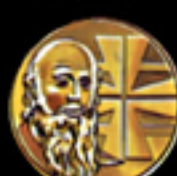
602 Turnvater Jahn