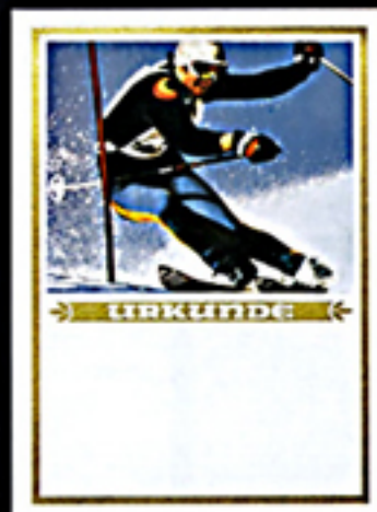
Urkunde 38 Größe 24 x 32 cm, Golddruck