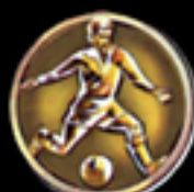
* 601 A Fußball