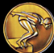
612 Schwimmen Da