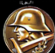
* 634 Soldat - Krieger