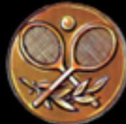
* 631 Tennis